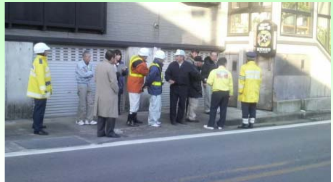
▲住民の方々をはじめ14名が参加しました