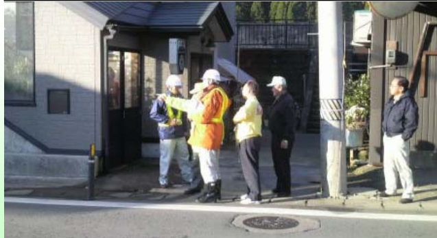
▲住民の方々の意見を聞きながら、過去の事故発生箇所などを確認しました