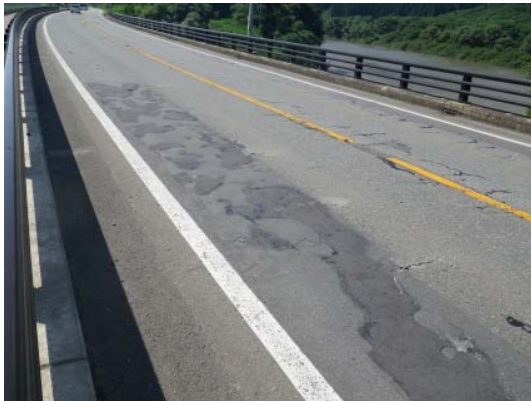
国道47号 本合海高架橋