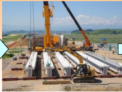
工場から運んできた橋桁