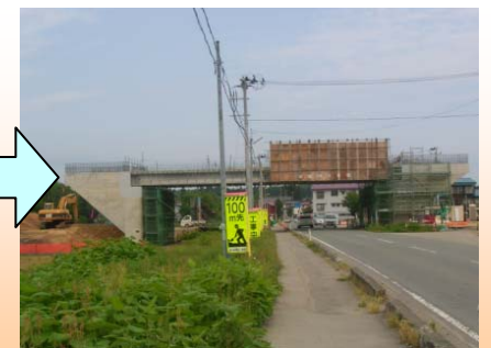
架設後、コンクリートを打設し鋼棒で橋を一体化させます

超大型クレーンを使用することにより本来3日かかる規制を半日に短縮することができました。西山こ道橋の架設工事完了により、新庄北道路工事で架設する橋は9橋のうち8橋が架設されました。