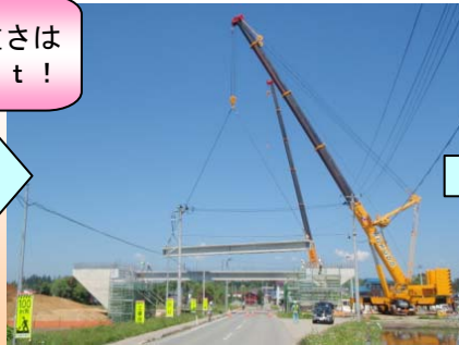
合計7本架設します