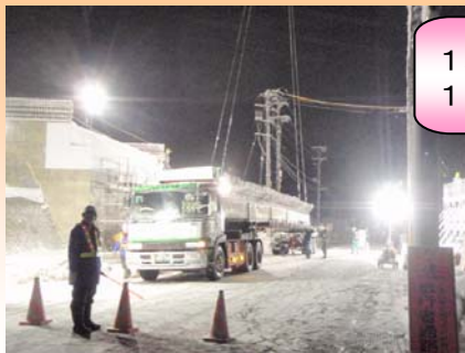
工場から運んできた橋桁