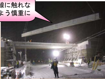
合計16本架設します