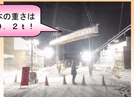
クレーンで1本ずつ架設します