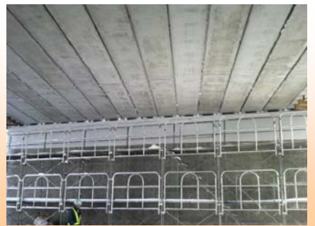
真下から見た写真

松本こ道橋の架設工事完了により、新庄北道路工事で架設する橋梁は9橋のうち7橋が架設されました。