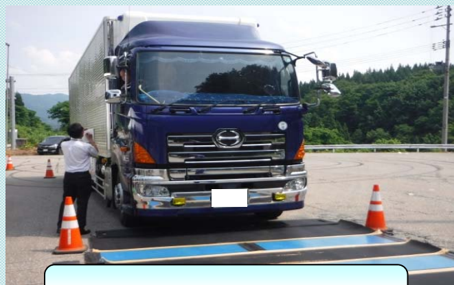
②特殊車両許可書の提示を求め