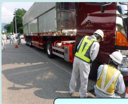
③車両の幅・長さ・高さを測定