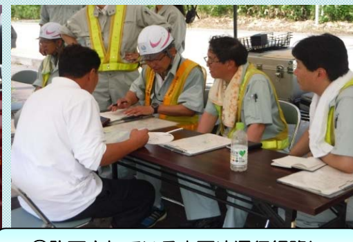
④許可されている車両や通行経路に違いがないか通行許可書を確認