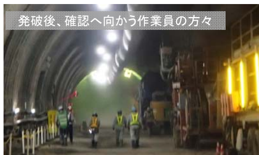
発破後、確認へ向かう作業員の方々