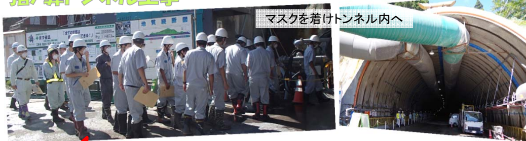
マスクを着けトンネル内へ