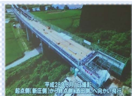
平成28年8月10日撮影 起点側(新庄側)から終点側(酒田側)へ向かい飛行

工事の様子を映した映像を見ながら、話を聞く生徒たち 映像には、UAVで空中から撮影されたものもあります