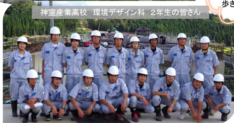
神室産業高校 環境デザイン科 2年生の皆さん