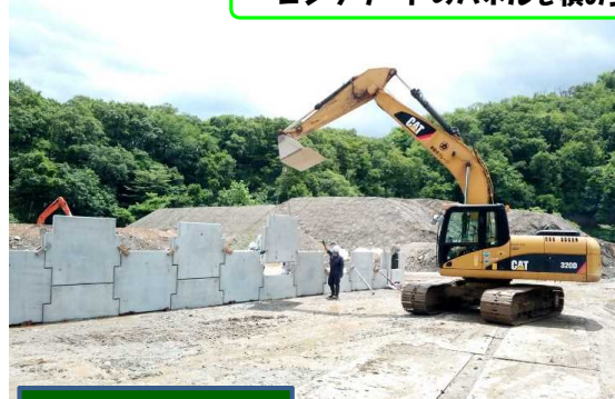
補強土壁施工状況