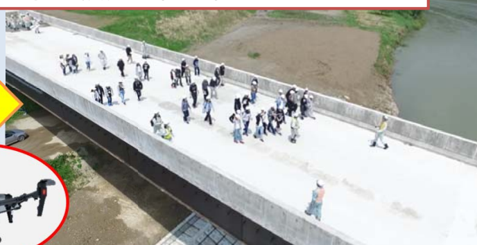
工事の進捗状況確認で使用しているドローンで撮影