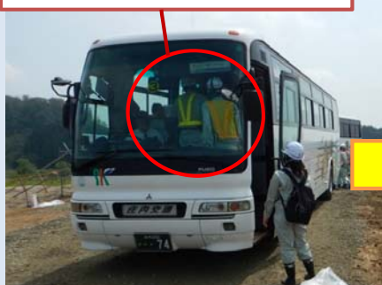
車内でDVDによる概要説明