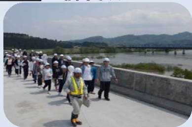
橋中央までウォーキング