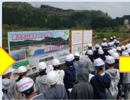
立看板による工事説明