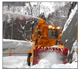
ロータリー除雪車