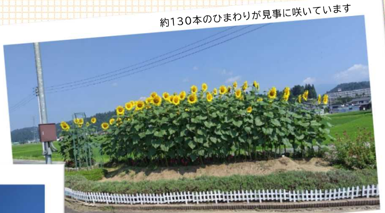
約130本のひまわりが見事に咲いています

学童保育に通う児童や 父兄・地域の皆さんが心をこめて 育ててくださっています。 7月にはひまわりで いっぱいになりました。