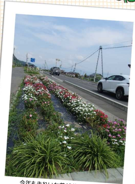
今年もきれいな花が咲いています

長年にわたる美化活動を讃え、 昨年、「山形河川国道事務所長賞」 を受賞されました。