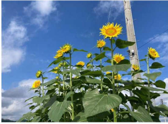
太陽に向かって元気よく！