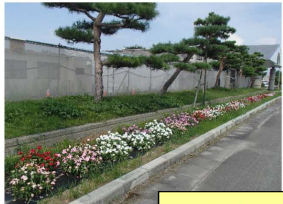
道の駅寒河江 チェリーランド前

寒河江フラワーロードは今年度から規模が縮小されましたが、チェリーランド前など、市内5ヶ所に花壇があります。