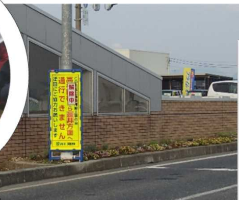
ラベンダー&カリブラコアが植えられています