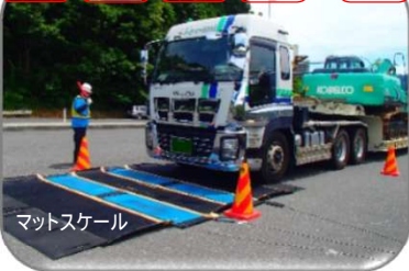
① マットスケール（はかり）に車体を乗せて総重量を測定