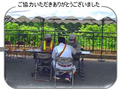
③ 通行許可証の有無と内容を確認 車両・通行経路に相違がないか細かくチェック