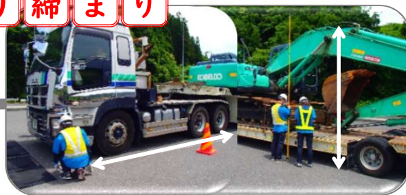
② 車体の高さ・長さ・幅を測定