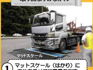
取り締まりのながれ