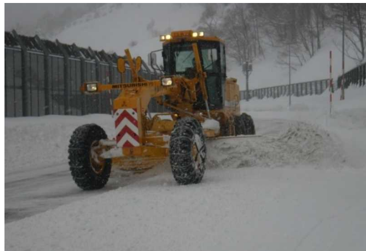
除雪グレーダ 押し潰されて固くなった道路の雪を 削り取ります