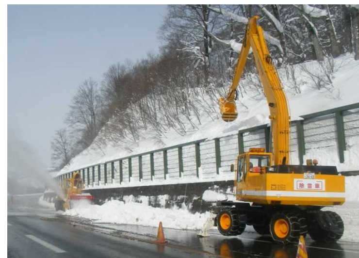
ロータリ除雪車&雪庇(せっぴ)処理車 雪庇処理車で道路脇に張り出した雪を落として ロータリ除雪車で遠くへ飛ばす作業をしています