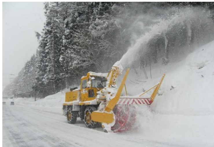
ロータリ除雪車 路肩にたまった雪を遠くへ飛ばして 道路の幅を確保します