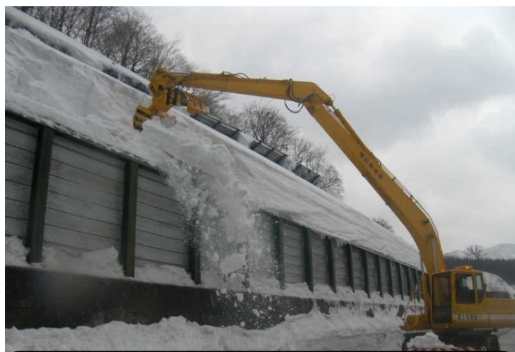
雪庇(せっぴ)処理車 道路脇に張り出した雪(雪庇)などをつかんで 崩落する前に落とします