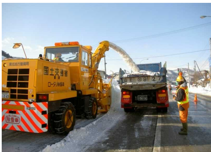
ロータリ除雪車&ダンプトラック 除雪で路肩にたまった雪を運び出し 道路の幅を確保します