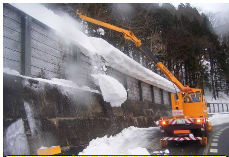
除雪トラック 除雪トラックについている装置で雪庇を処理します