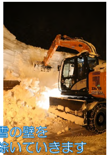
高い雪の壁を取り除いていきます

トンネル坑口部は、車の行き来が多い日中は、なかなか除雪が出来ないところです。 今回の夜間除雪で集中的に作業した部分です。