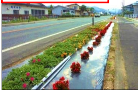
② 梅沢町内会公民館 運営委員会