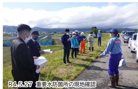
R4.5.27 重要水防箇所の現地確認