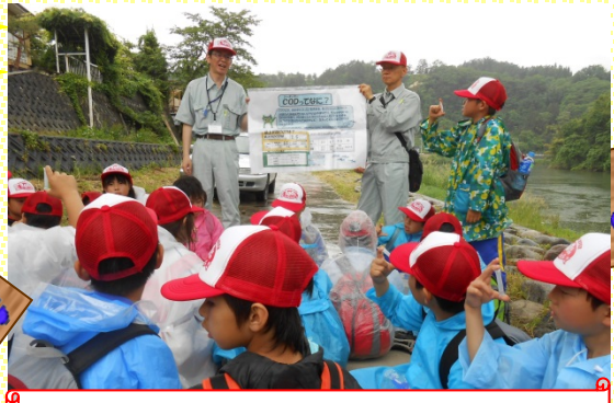
最上川の水はキレイかな?