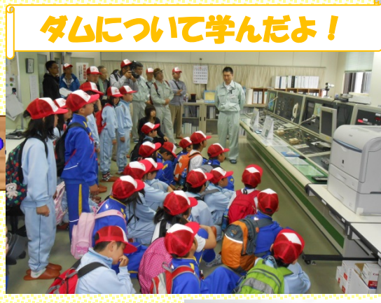
ダムについて学んだよ!