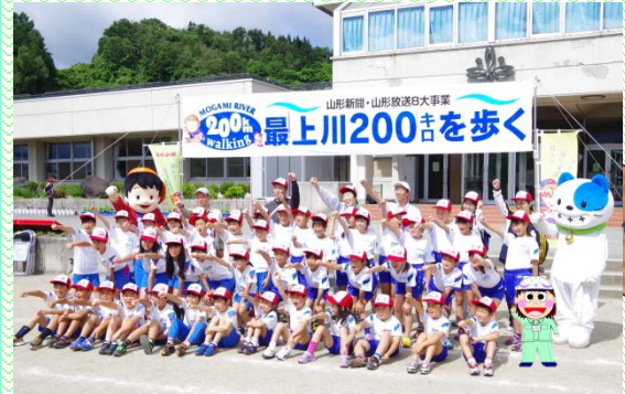
今日も元気にしゅっぱ〜つ!!