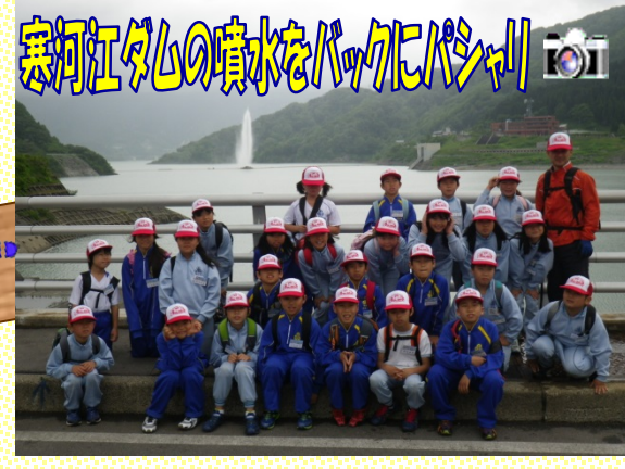
寒河江ダムの噴水をバックにパシャ!