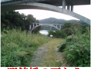
明鏡橋の下から スタート