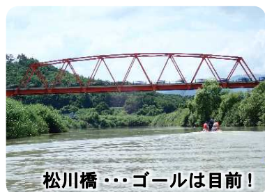
松川橋・・・ゴールは目前!

普段は陸上から河川を巡視していますが、陸上からでは確認できない川岸や護岸などの構造物の損傷、土砂の堆積状況など、河川の状態把握のため、ボートで接近しながら目視点検を行いました。水上から巡視したところ、補修には至らない河川構造物の劣化などを確認しました。今後も継続的に巡視していく予定です。