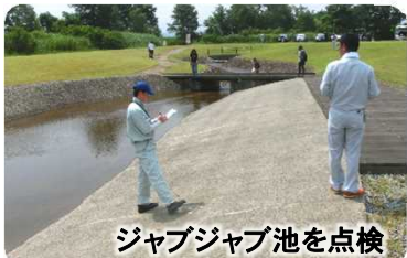
ジャブジャブ池を点検