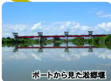
ボートから見た崧郷堰