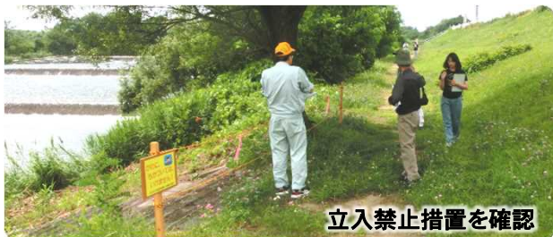
立入禁止措置を確認