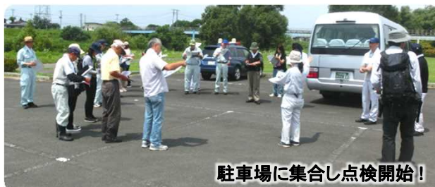
駐車場に集合し点検開始!