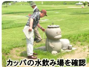
カッパの水飲み場を確認