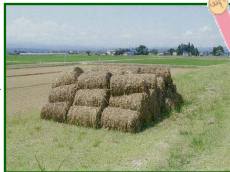
刈草はロール状にして提供しています