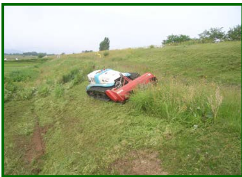
草刈りにはリモコン式除草機を使用