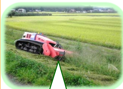
リモコン式除草機を使用して除草します