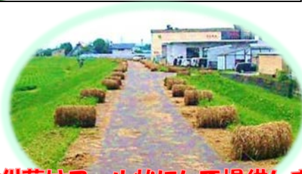
※刈草はロール状にして提供します