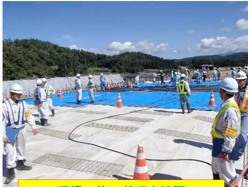
現場の施工状況を確認