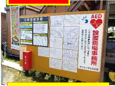
工事内容が見やすく提示