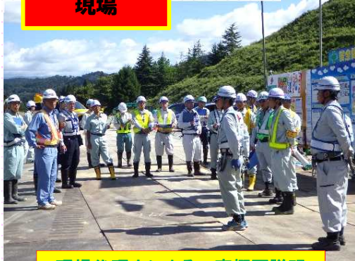
現場代理人による工事概要説明