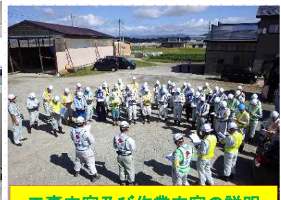
工事内容及び作業内容の説明