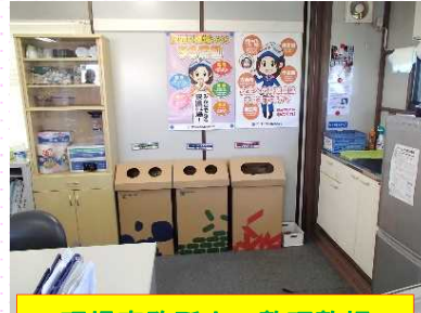
現場事務所内の整理整頓