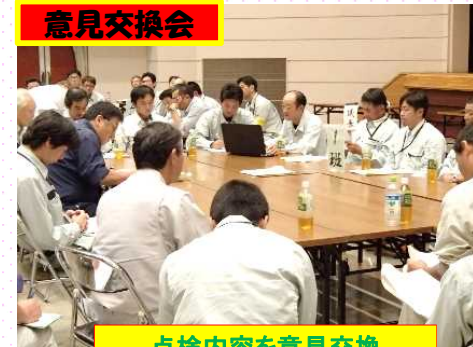
点検内容を意見交換