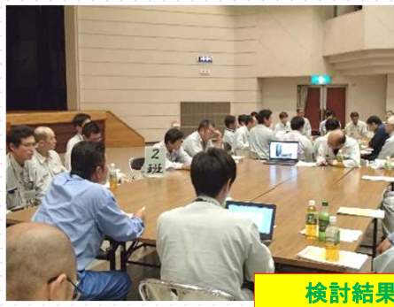
検討結果を発表・討議