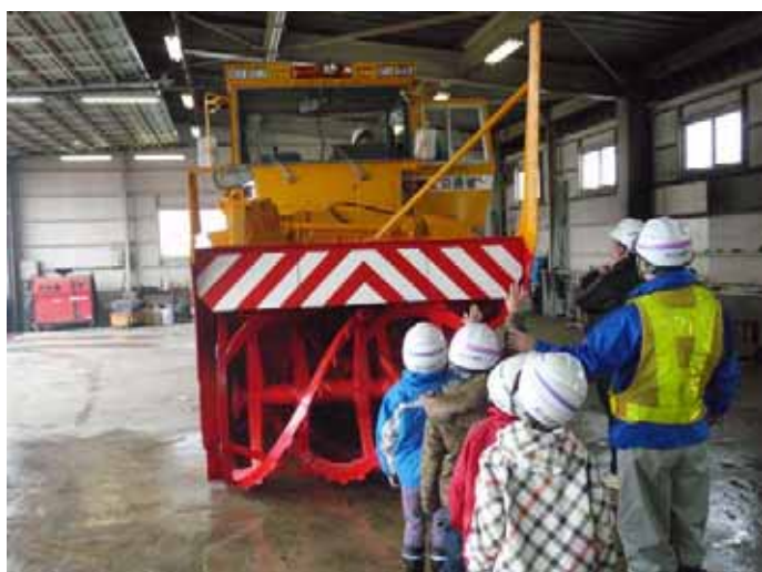
▲手をあげると見えますか？