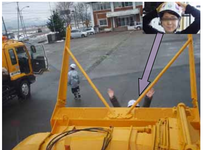
▲記者E・Tも参加。身長160cmの大人でも近づくとこのくらいしか見えません!