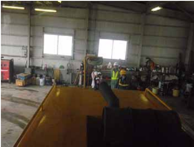
▲後ろはこんなに離れないと見えないんだね！