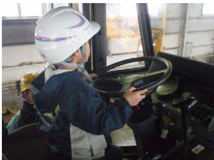
▲運転席からの眺めはどうか？