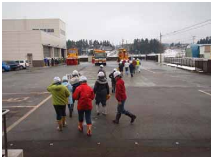
▲2班に分かれて。除雪車に乗ってみよう!