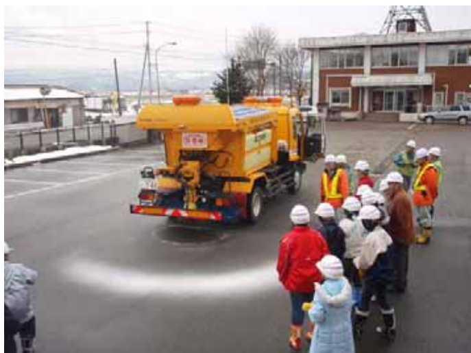
▲凍結抑制剤散布車の実働。興味津々。