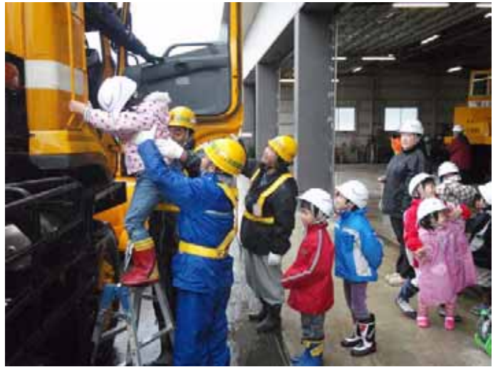
▲尾花沢国道北地区維持工事・(株)中嶋組のみなさんが安全に乗り降りさせてくれました