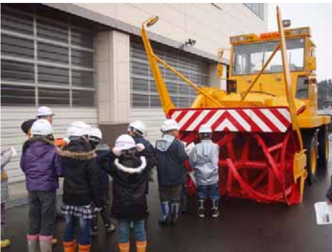
▲1列に並んで、運転席から何番目のお友達まで見えるか体験しよう!