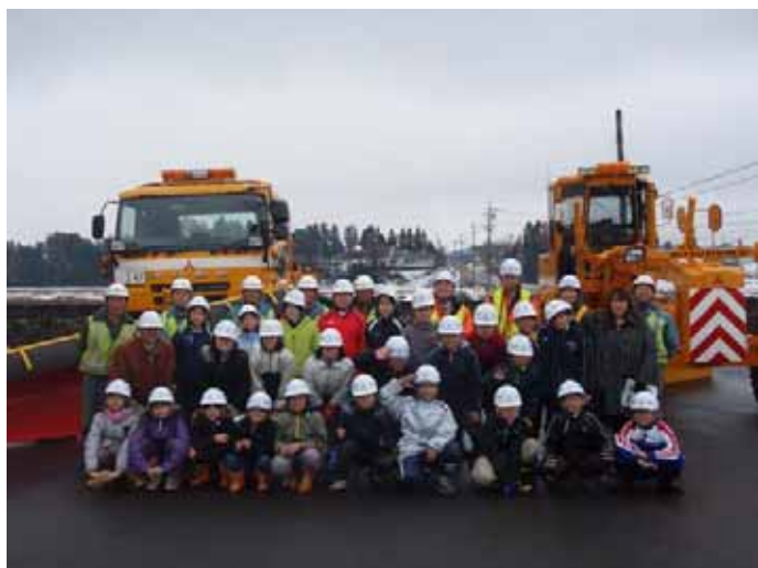
▲除雪車の前で記念撮影。また来てね！