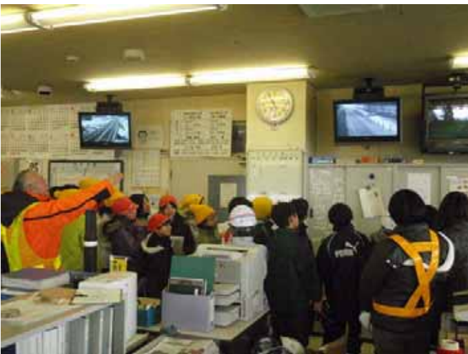
▲所長から出張所の仕事などを説明