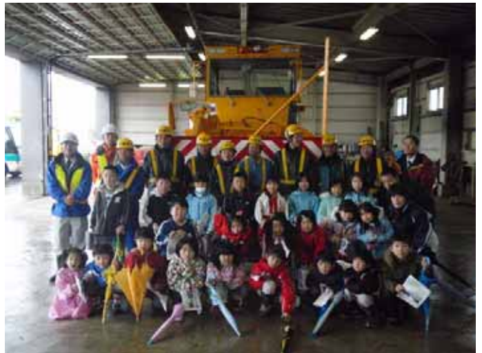
▲記念にパチリ。寒かったけど、みんな一生懸命勉強してくれました。