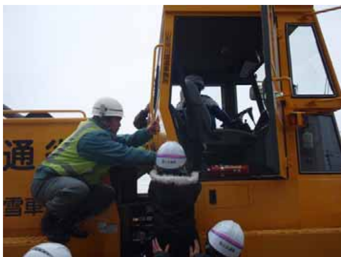
▲乗り降りは尾花沢国道南地区維持工事・ 升川建設(株)のみなさんががっちりサポート