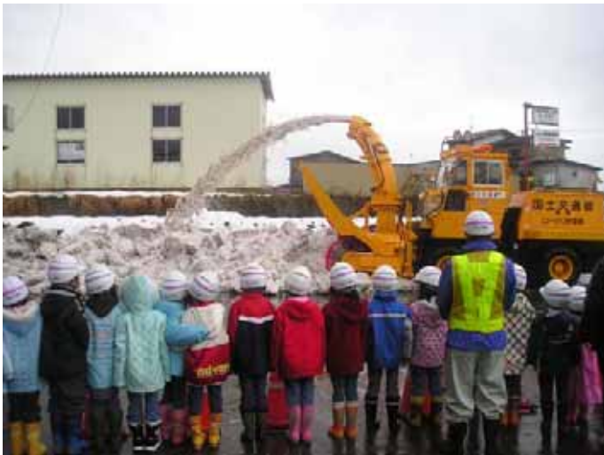
▲今日乗ったロータリー除雪車の実働。すごい迫力！