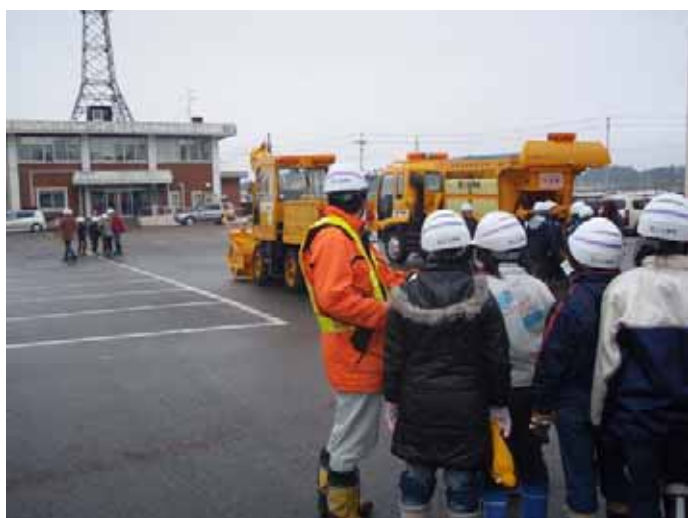
▲「災害のときには無線機を使うこともあるんだよ」無線機体験も実施