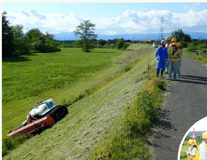
リモコン式除草機械の操縦体験