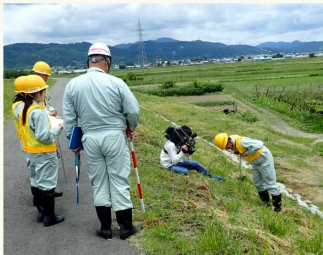
貫入棒で堤防の強度を確認