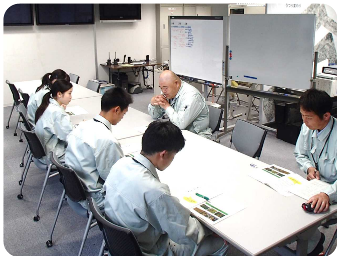
▲ 出張所長の説明を聞いた後、いざ現場へ!

出張所長から国土交通省や最上川の概要、河川管理の仕事についての説明を受けた後、最上川の現場に出発!堤防を歩いて点検し、その結果をまとめたり、除草作業を体験することによって、河川整備や管理の重要性を学びました。