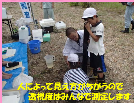
人によって見え方がちがうので透視度はみんなで測定します