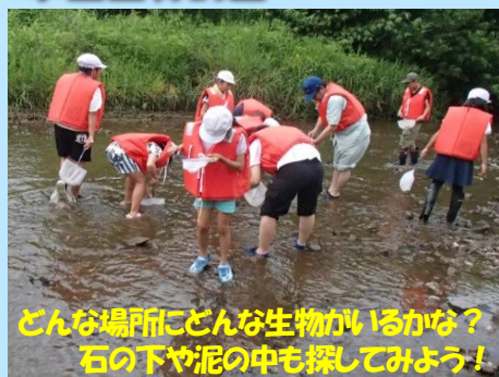
どんな場所にどんな生物がいるかな? 石の下や泥の中も探してみよう!