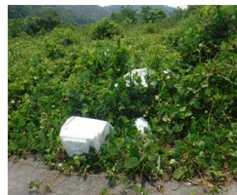
左岸 No.60付近 河川緑地公園内 ゴミの投棄 (発泡スチロール箱4袋) 6月21日確認 ※回収