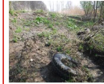
右岸 No.77付近 管理用通路裏 河岸側 不法投棄 (古タイヤ2本) 4月22日確認 ※回収