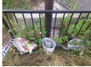
右岸 No.62+20 金井神排水樋管 堤内水路 農業用資材の投棄 (塩ビ波板・肥料袋) 6月24日確認 ※回収