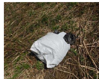
左岸 No.68+115 さくら大橋 下流側 農業用資材の投棄 (農業用ビニールシート) 4月12日確認 ※回収