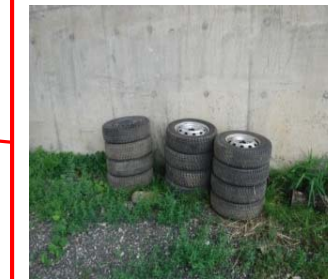
置賜白川右岸 No.6+60 白川橋直下 不法投棄 (古タイヤ12本) 7月26日確認 ※8月9日撤去