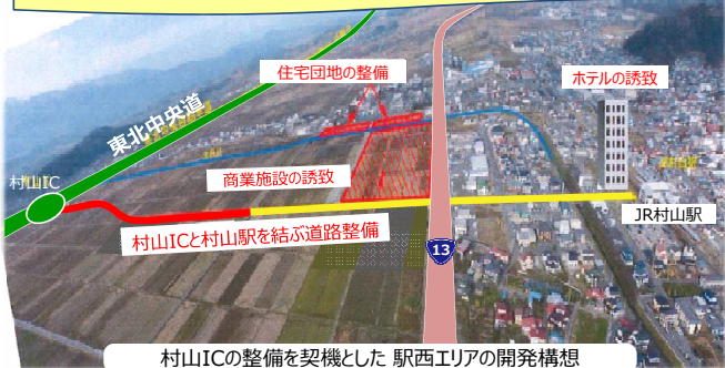
村山ICの整備を契機とした 駅西エリアの開発構想

高速道路への好アクセスを活かしたまちづくりやイベントの開催 高速道路を活かした広域都市圏の形成