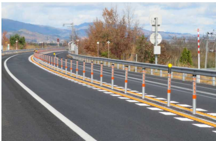
東北中央自動車道(ネクスコ区間)における中分ワイヤロープ設置状況