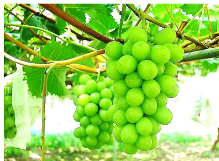
周辺エリアの農産物「シャインマスカット」

スマートICの整備により、温泉施設や屋内外のスポーツ施設が整備された西公園を中心とした観光・レクリエーション施設へのアクセスが向上し、交流人口の拡大が期待される。