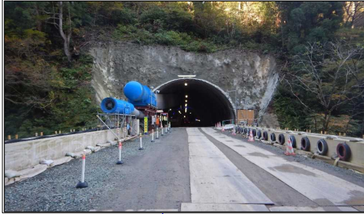
有田沢橋(酒田方向)