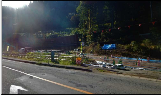
高屋地区(新庄方向)