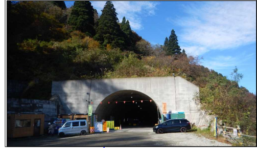
猪ノ鼻トンネル(酒田方向)