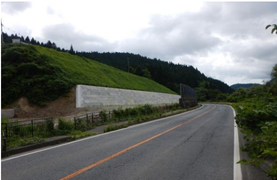
高屋地区(酒田方面)