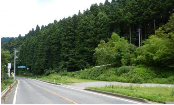
高屋地区(新庄方面)