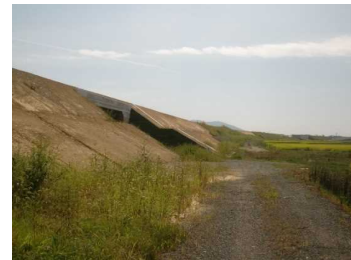
萩野地区(尾花沢方向)