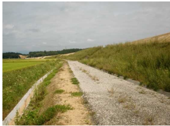
萩野地区(湯沢方向)