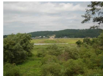
荒屋地区(湯沢方向)