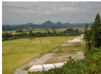
上台地区(湯沢方向)