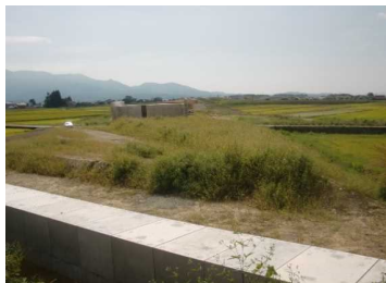
萩野地区(尾花沢方向)