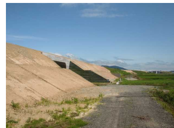
萩野地区(尾花沢方向)