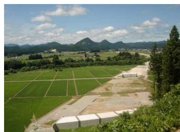
上台地区(湯沢方向)