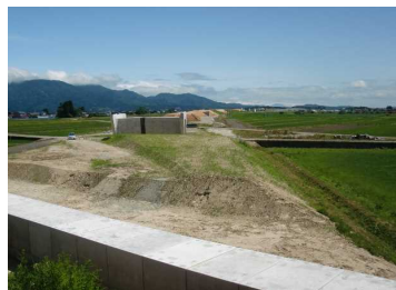
萩野地区(尾花沢方向)