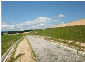
萩野地区(湯沢方向)