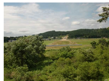
荒屋地区(湯沢方向)