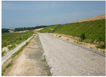
萩野地区(湯沢方向)