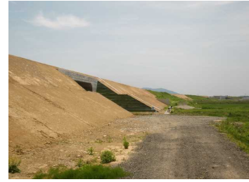
萩野地区(尾花沢方向)