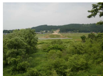
荒屋地区(湯沢方向)