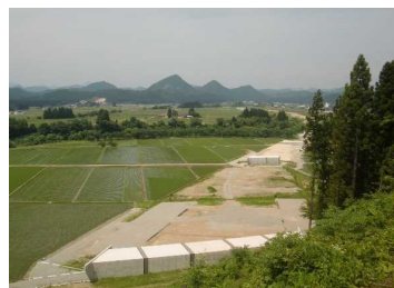
上台地区(湯沢方向)