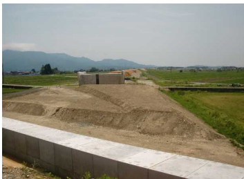
萩野地区(尾花沢方向)