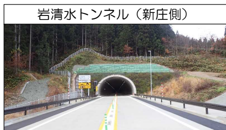
岩清水トンネル (新庄側)