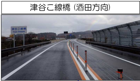
津谷こ線橋 (酒田方向)