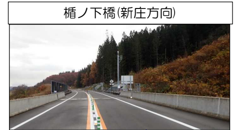
楯ノ下橋(新庄方向)