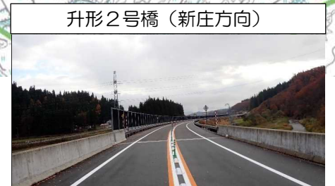
升形2号橋 (新庄方向)