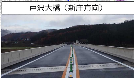
戸沢大橋 (新庄方向)