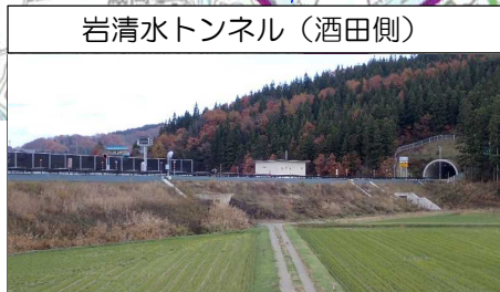
岩清水トンネル (酒田側)