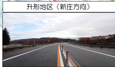
升形地区 (新庄方向)