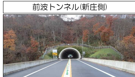
前波トンネル(新庄側)