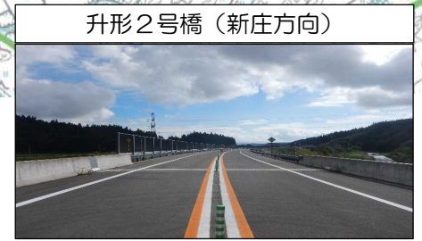
升形2号橋 (新庄方向)