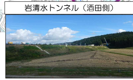
岩清水トンネル (酒田側)