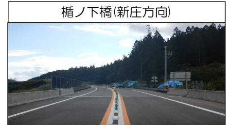
楯ノ下橋(新庄方向)