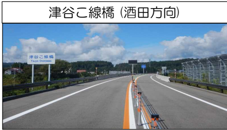
津谷こ線橋 (酒田方向)