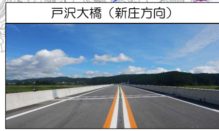
戸沢大橋 (新庄方向)