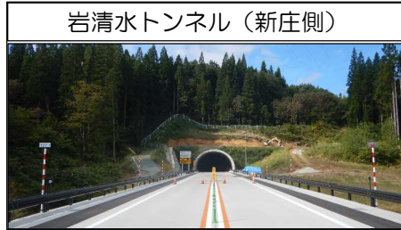
岩清水トンネル (新庄側)