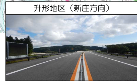
升形地区 (新庄方向)