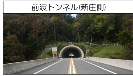
前波トンネル(新庄側)