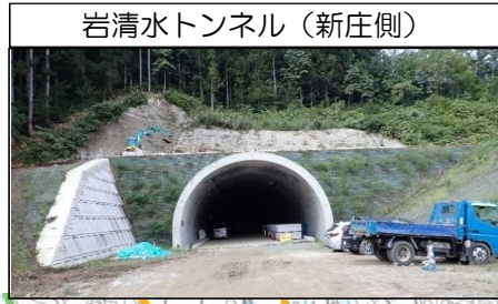
岩清水トンネル (新庄側)