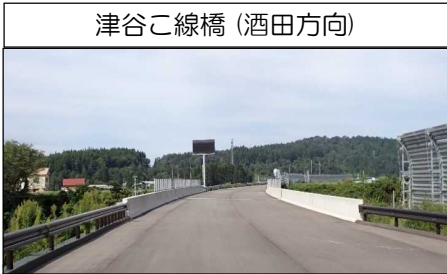
津谷こ線橋 (酒田方向)