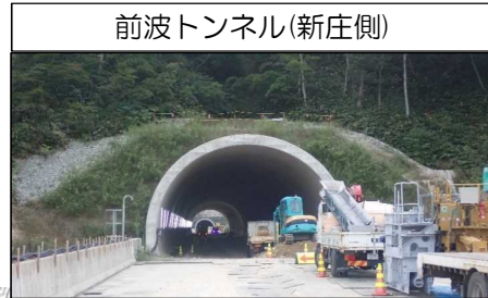
前波トンネル(新庄側)