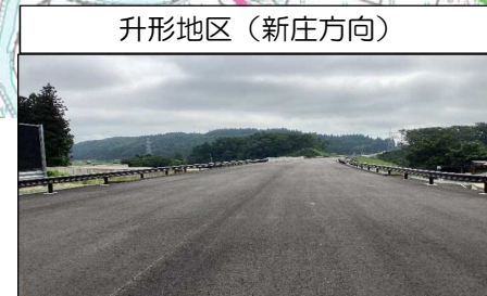
升形地区 (新庄方向)