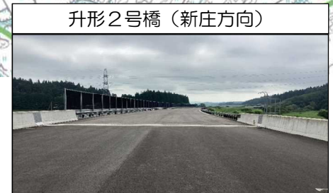
升形2号橋 (新庄方向)