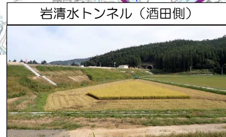
岩清水トンネル (酒田側)