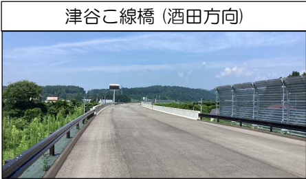
津谷こ線橋 (酒田方向)