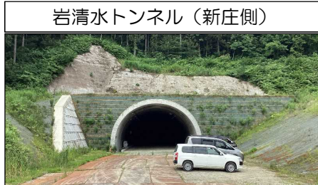
岩清水トンネル (新庄側)