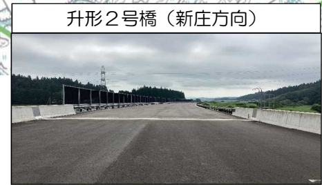
升形2号橋 (新庄方向)