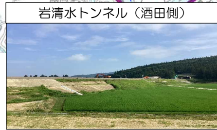
岩清水トンネル (酒田側)