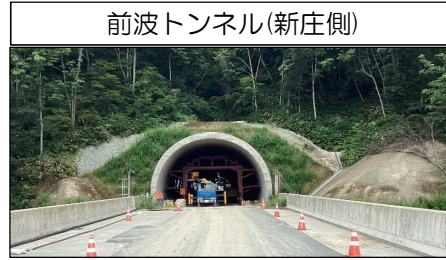
前波トンネル(新庄側)