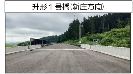
升形1号橋(新庄方向)