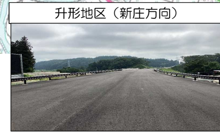
升形地区 (新庄方向)