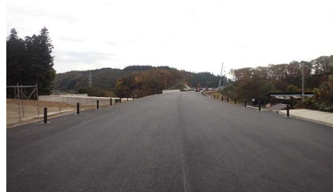
升形地区(新庄方向)