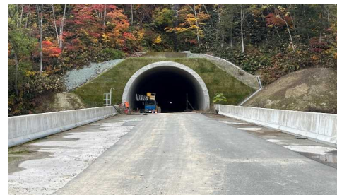
前波トンネル(新庄側)