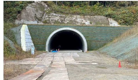
岩清水トンネル(新庄側)