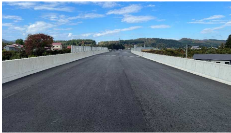
津谷こ線橋(酒田方向)