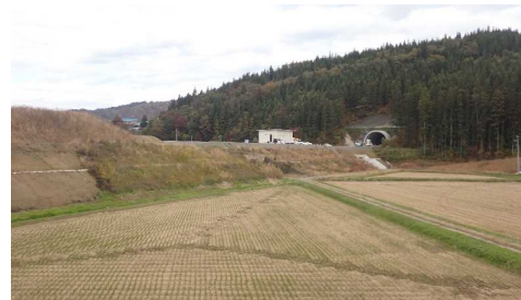
岩清水トンネル(酒田側)