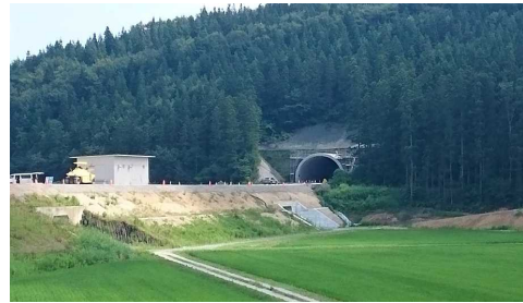
岩清水トンネル(酒田側)