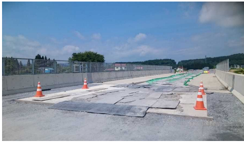
津谷こ線橋(酒田方向)