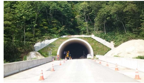
前波トンネル(新庄側)