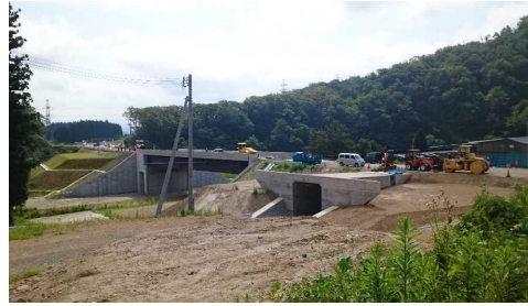
升形地区(新庄方向)