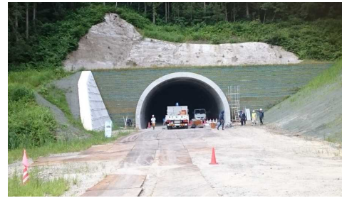
岩清水トンネル(新庄側)