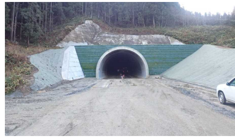
前波地区(酒田方向)