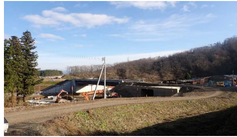
升形地区(新庄方向)