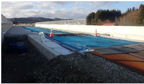
津谷こ線橋(酒田方向)