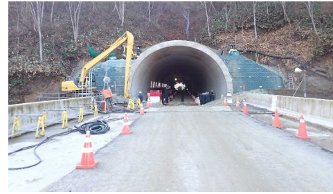
前波トンネル(新庄側)