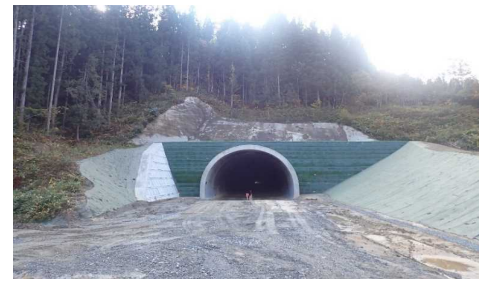
前波地区(酒田方向)