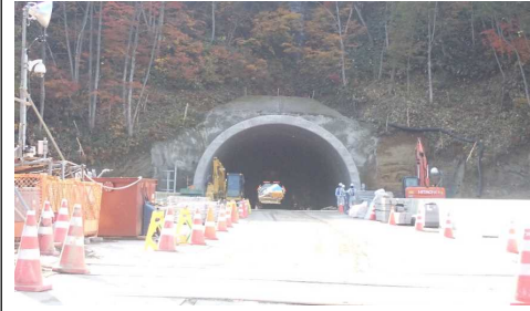
前波トンネル(新庄側)