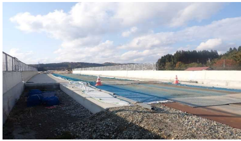
津谷こ線橋(酒田方向)