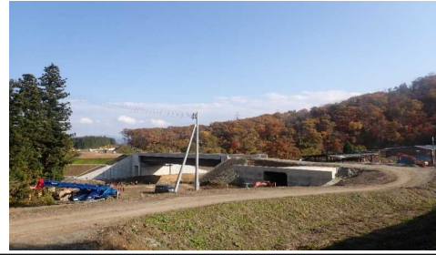
升形地区(新庄方向)