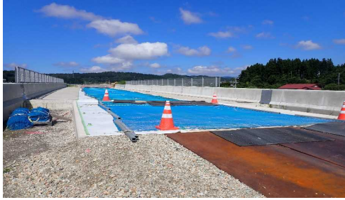
津谷こ線橋(酒田方向)