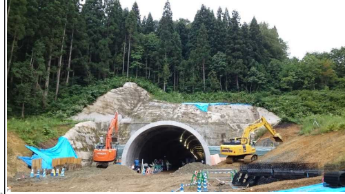
前波地区(酒田方向)