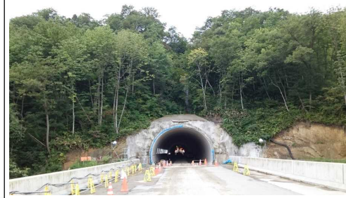
前波トンネル(新庄側)