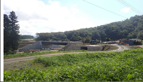
升形地区(新庄方向)