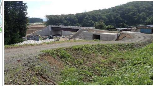
升形地区(新庄方向)