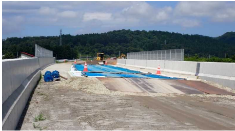
津谷こ線橋(酒田方向)