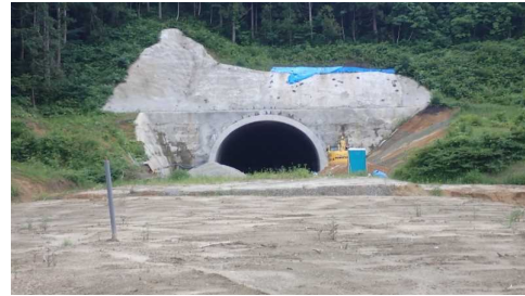
前波地区(酒田方向)