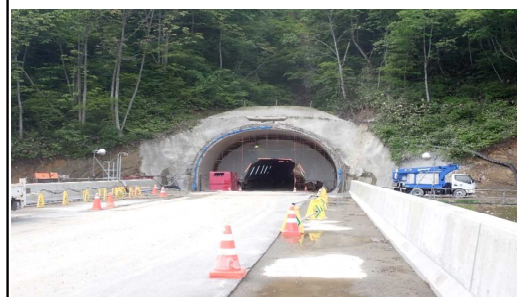
前波トンネル(新庄側)