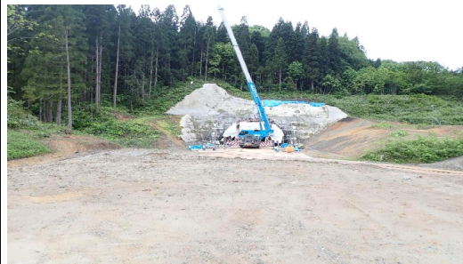
前波地区(酒田方向)