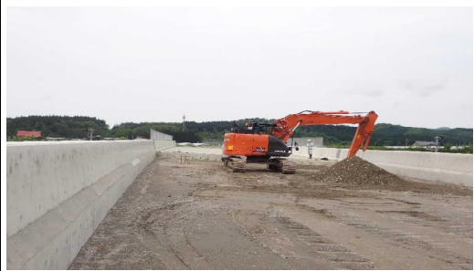
津谷こ線橋(酒田方向)