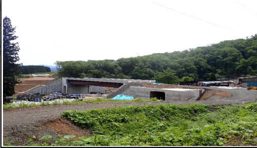
升形地区(新庄方面)