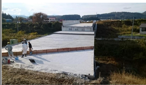
津谷こ線橋(酒田方向)