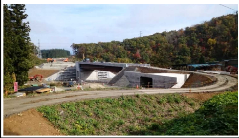
升形地区(大崎方向)