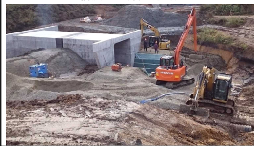
前波地区(酒田方向)