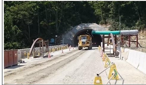
前波トンネル(酒田方面)