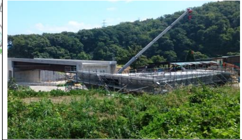
升形地区(新庄方面)