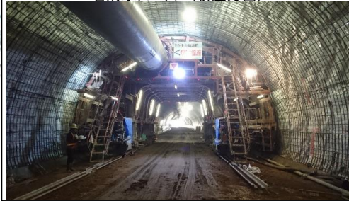
岩清水トンネル(新庄方面)