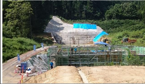
前波地区(酒田方面)