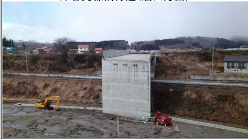
津谷跨線橋付近(酒田方面)