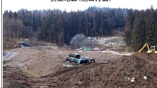
前波地区(酒田方面)