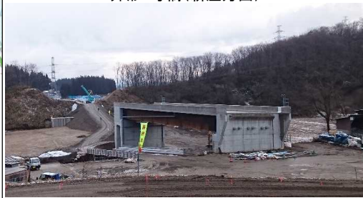
升形3号橋(新庄方面)