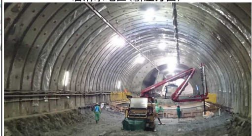
岩清水地区(新庄方面)