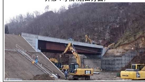
升形4号橋(酒田方面)