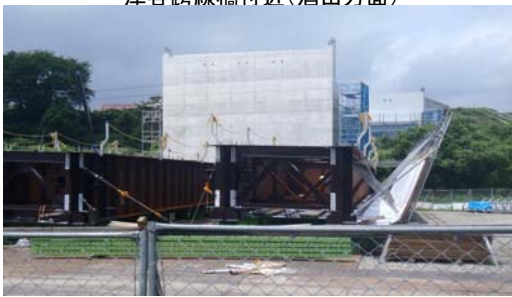
津谷跨線橋付近(酒田方面)