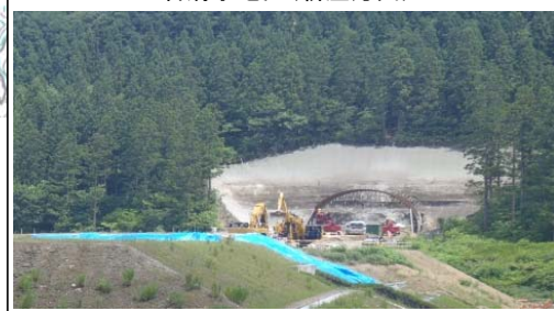
岩清水地区(新庄方面)