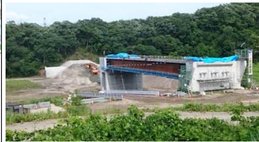
升形3号橋(新庄方面)