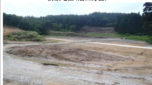
前波地区(酒田方面)