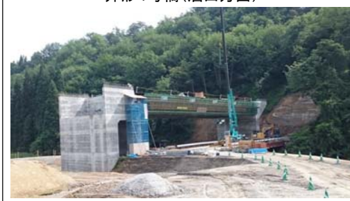
升形4号橋(酒田方面)