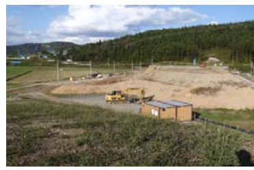
岩清水地区(新庄方面)