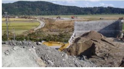
津谷跨線橋付近(新庄方面)