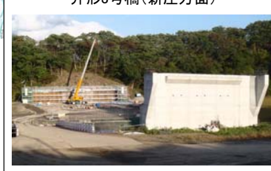
升形3号橋(新庄方面)