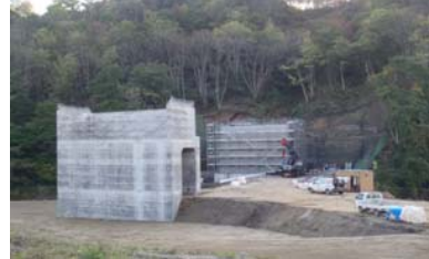
升形4号橋(酒田方面)