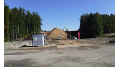
升形地区(新庄方面)